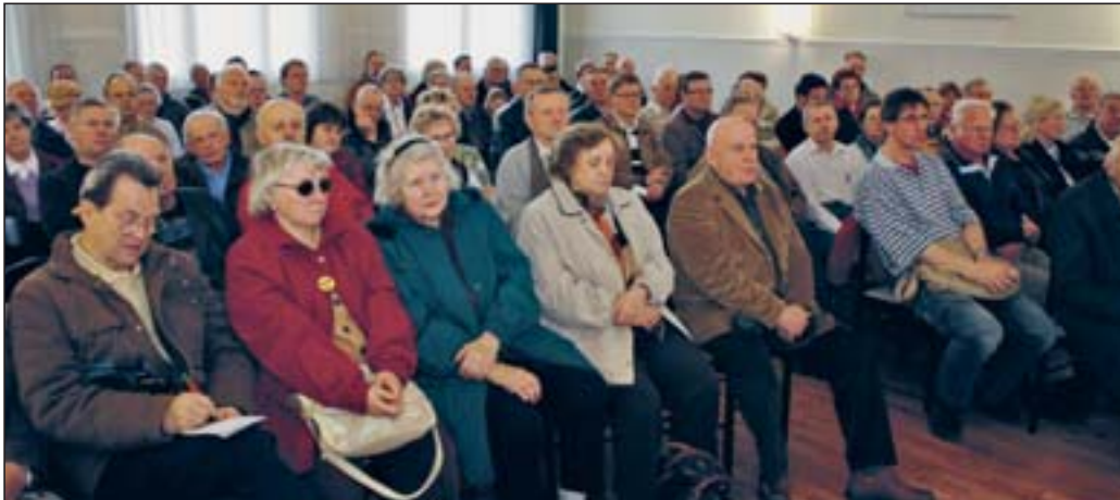
Gut besucht war die Mitgliederversammlung in der Aula der Dortuschule.

Mitgliederversammlung im Verein „Krähenbusch“, Potsdam-West